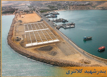
بندر شهید کلانتری