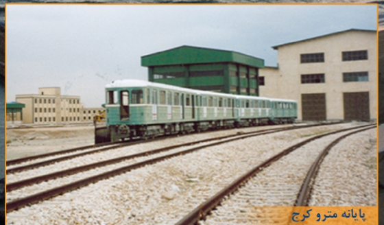
ایستگاه مترو و کرج