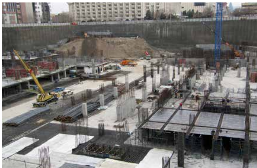
پروژه جهان‌مال مشهد

تشکیل سندیکاها ناگزیر تاریخ بوده و در این مسیر صنف شرکت‌های مقاطعه‌کار با اتکاء به دانش اکادمیک و هوشیاری اجتماعی خود خیلی زود این ضرورت را تشخیص دادند و از سال ۱۳۲۶ این رسالت سنگین را به دوش کشیده و تا امروز فراز و فرود فراوان داشته، کمر خم کرده ولی دوباره ایستاده و هرگز از پای ننشسته است