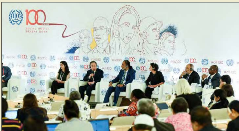
در یکصد و هشتمین کنفرانس بین‌المللی کار مطرح شد: