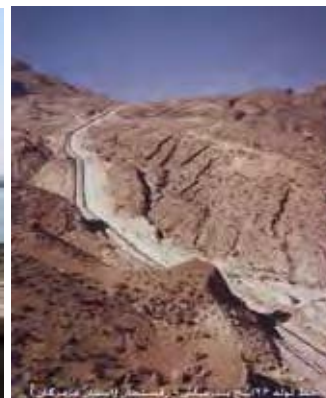
سد نیمه‌تمام سد گناوه (استان بوشهر)