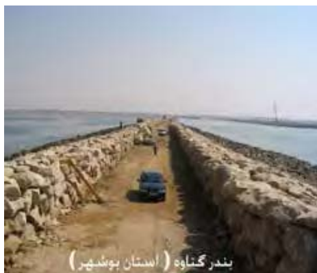
بندر گناوه (استان بوشهر)