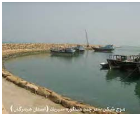
موج شکن بندر چند منظوره سیریک (استان هرمزگان)