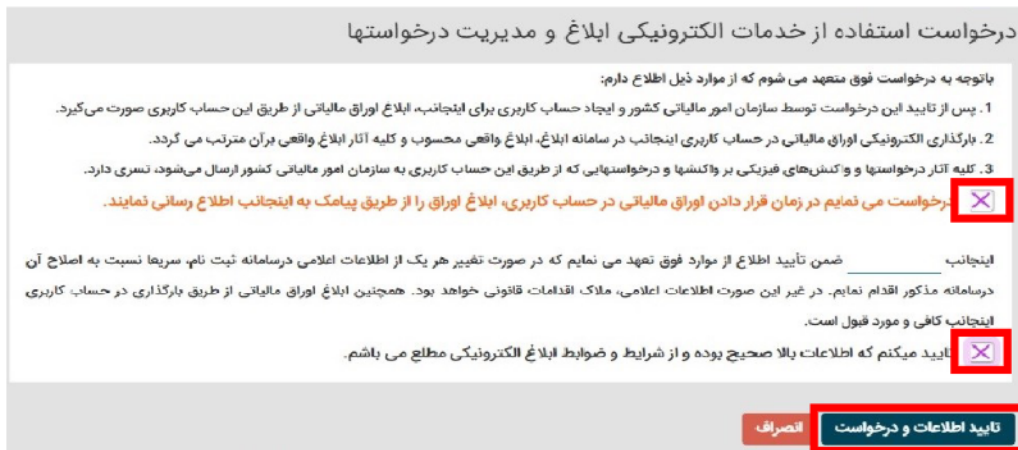
شکل شماره ۳

پس از کلیک بر روی دکمه "فعال سازی ابلاغ الکترونیک، (شکل شماره ۲)، برگه "درخواست استفاده خدمات الکترونیکی ابلاغ و مدیریت درخواستها" (شکل شماره ۳) برای شما باز می شود. با فشردن گزینه های ذیل و تایید آن، ابلاغ الکترونیک برای شما فعال شده و اوراق مالیاتی که از این تاریخ به بعد صادر می شوند در "کارتابل ابلاغ الکترونیک" (شکل شماره ۴) شما قرار خواهند گرفت.