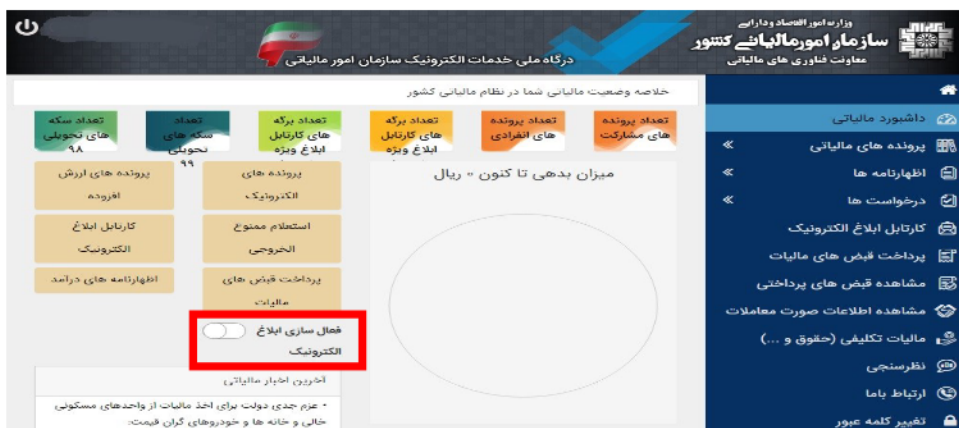
شکل شماره ۲