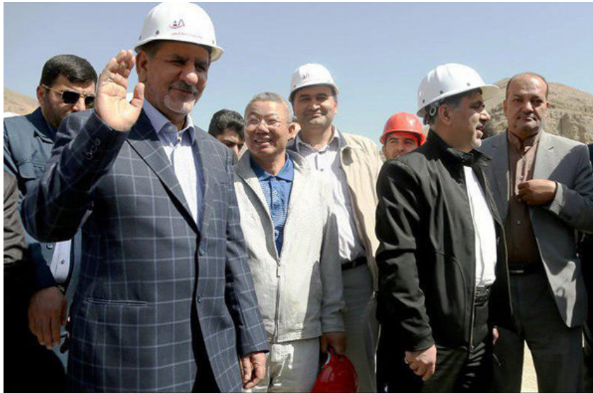
بازدید معاون اول رئیس جمهوری از روند پیشرفت آزاد راه تهران - شمال