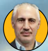
سید حمید پورمحمدی رئیس سازمان برنامه و بودجه سیاست‌های بهینه‌سازی مصرف در بودجه ۱۴۰۴