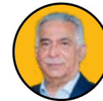
محمد رضا بهرامن نایب رئیس اول اتاق بازرگانی ایران