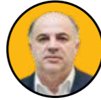
همایون حائری معاون وزیر نیرو (معاونت برق و انرژی)