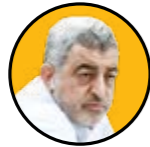
رضایق پدیدار رئیس فدراسیون صنعت نفت ایران