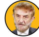
علی آقا محمدی مشاور اقتصادی رهبر انقلاب