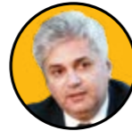
علیرضا مقدس زاده رئیس شورای هماهنگی تشکلهای مهندسی، صنفی و حرفه‌ای کشور