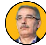
بهمن دامان رئیس سندیکای شرکت‌های ساختمانی ایران