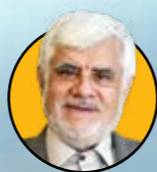
محمد رضا عارف محمد رضا عارف معاون اول رئیس جمهور سیاست‌های بهینه‌سازی در دولت چهاردهم