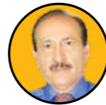
محمد حسن عبدالله شمشیرساز رئیس جامعه مهندسان مشاور ایران