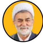
موسی احمدی رئیس کمیسیون انرژی مجلس