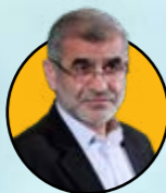
علی نیکزاد نایب رئیس مجلس و وزیر سابق مسکن برنامه‌های مجلس برای توسعه قراردادهای مشارکت عمومی- خصوصی