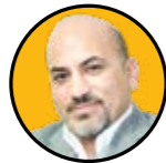
حمیدرضا صالحی رئیس فدراسیون صادرات انرژی و صنایع وابسته ایران